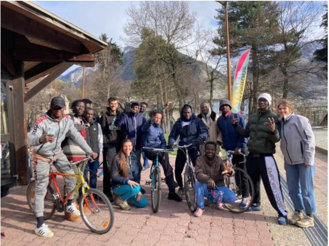
Atelier en partenariat avec l'Association Eko!

Réparer, recycler, rouler : un cercle vertueux