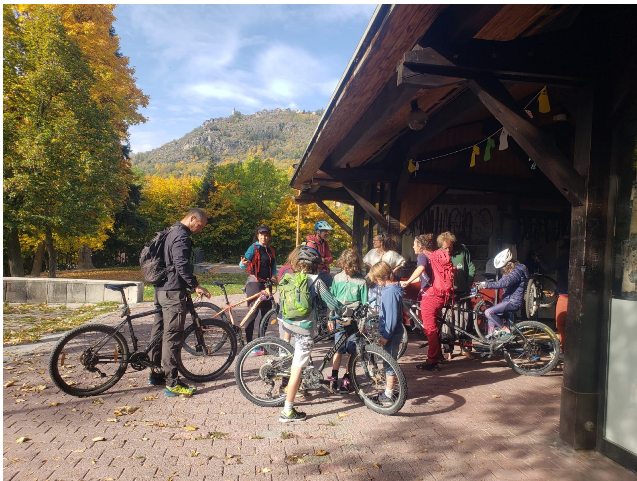
Balade familiale au départ de l'atelier